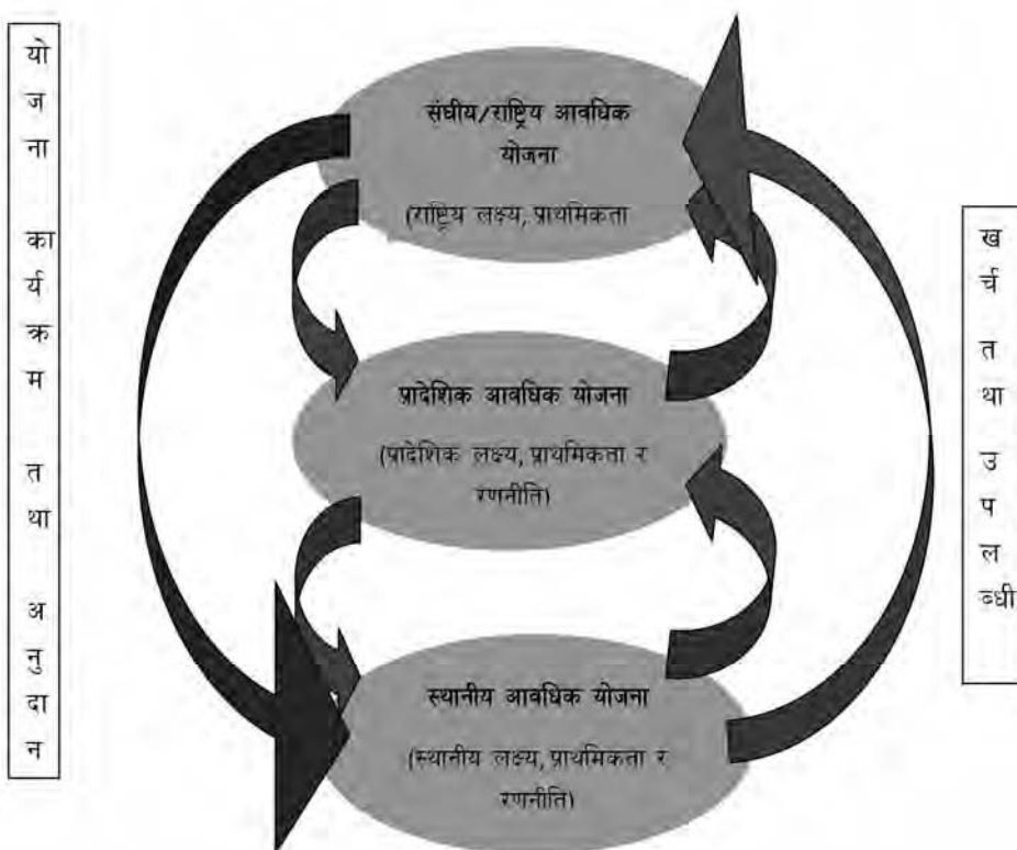
चित्र १.१: संघ, प्रदेश र स्थानीय तहको आवधिक योजनाबीचको अन्तरसम्बन्ध

संघ, प्रदेश र स्थानीय तहको आवधिक योजनाहरू बीचमा अन्तरसम्बन्ध रहेको हुन्छ । जसलाई तल दिइएको चित्रबाट स्पष्ट गरिएको छ ।